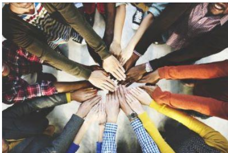
Handen heb je om te delen

Voor de een is dat een signaal van het einde der tijden, voor de andere het orgelpunt van een transitieperiode en een mogelijkheid voor een nieuw begin.