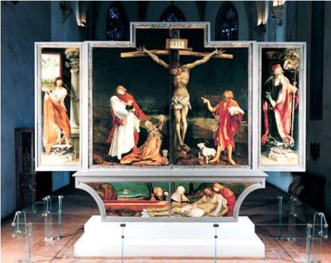
Matthias Grünewald, Isenheimer Altar

En dan vraag ik: 'Waarom geloof je in God? Want dat doe je toch?' 'Ja. Dat doe ik denk ik wel. Ik kan daar geen zinnig antwoord op geven, ik geloof in God omdat ... nou ja, het licht, zonsopgangen, zonsondergangen, de geur van de zee, de geur van een klein meisje van één maand oud van wie ik net in februari oom ben geworden, en kunst, Giotto en Rembrandt en, ja, vooral vanwege kunst, en Bob Dylan en Johann Sebastian Bach natuurlijk, en alle prachtige meisjes op de wereld, vooral jij, en ik geloof vanwege de kracht van het evangelie dat Johannes tweeduizend jaar geleden heeft opgeschreven, en dat me toch recht in mijn hart raakt.'